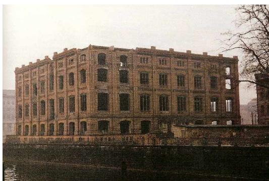
Bauakademie (ausgebrannt) – um 1959 –

Innerhalb der Arbeitsgemeinschaft des Fördervereins „Nutzung und Finanzierung für die wieder zu errichtende Bauakademie“ waren bereits vor der Ausschreibung von zwei namhaften Architekten- und Bauingenieurbüros Baukosten in Höhe von rd. 48 Mio. Euro ermittelt worden. Diese Größenordnung wurde in einer Masterarbeit, die an der Technischen Universität Berlin erstellt worden ist, bestätigt. Die Masterarbeit ist mit einem Preis für Stadtentwicklung ausgezeichnet worden.