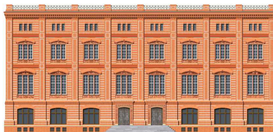
Das „Digitale Modell der Bauakademie“ (Nordfassade) © Dipl.-Ing. David Bornemann, Dipl.-Ing. Thomas Rox, Förderverein Bauakademie

In die Wiedererrichtung der Schinkelschen Bauakademie schien im Herbst 2008 Bewegung gekommen zu sein. Die Liegenschaftsfonds Berlin GmbH & Co. KG schrieb das Gelände, auf dem das Gebäude der Bauakademie stand, mit Bedingungen zum Verkauf aus. Der Investor sollte das Gebäude nach dem historischen Vorbild wieder errichten und überwiegend einer Stiftung kostenlos den Betrieb einer ebenfalls zu gründenden Akademie für Architektur und Städtebau ermöglichen. Etwa 25 vH der Fläche konnte der Investor selbst nutzen. Das Verfahren wurde im Februar 2010 abgebrochen. Einerseits wurden von Investoren die Bedingungen für betriebswirtschaftlich unrealistisch angesehen, andererseits akzeptierte die Öffentliche Hand nicht das Angebot, das Gebäude lediglich als „erweiterten Rohbau“ mit weitgehend historischen Fassaden zu bauen. Im Inneren war nur eine bauaufsichtlich notwendige Ausstattung ohne Innenrekonstruktion geplant. Ferner vertrat der verbliebene Interessent die Auffassung, dass sein Beitrag in Höhe von rd. 15 Mio. Euro zur Finanzierung der Wiederaufbaukosten ausreiche. Dies hätte für die Öffentliche Hand ein erhebliches Risiko bedeutet, da andere Kalkulationen wesentlich höhere Baukosten ergeben haben.